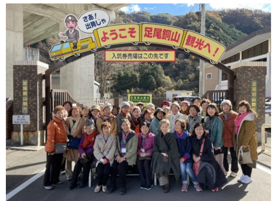
若葉会の研修ツアー