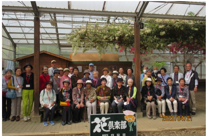
南房総の花俱樂部にて

日常的な行事として、月例会での食事会や祝宴も復活しました。そのほか、藤寿会では2回/月の健康麻雀、逆井親交会の同じく2回/月の健康体操が好評です。これまでも折に触れて健康ウォーキングを実施してきましたが、これからも、スマホ片手に歴史探索を行いながら、より充実した健康ウォーキングを続ける予定です。