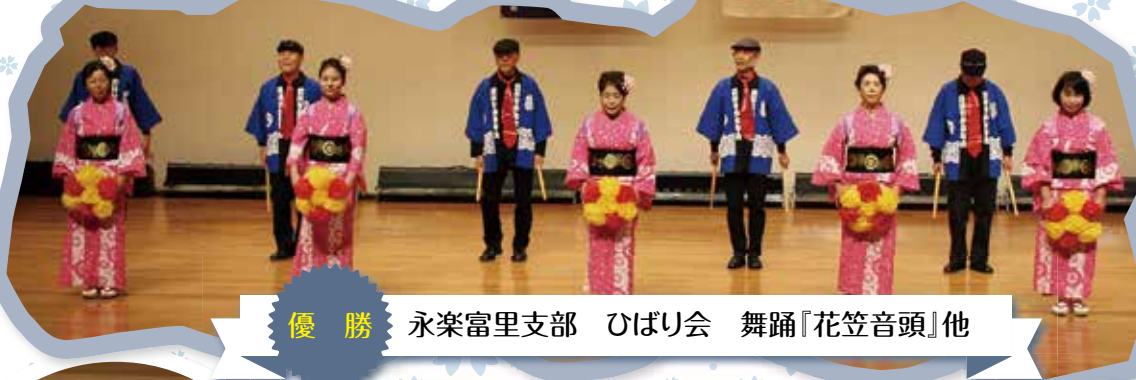
優勝 永楽富里支部 ひばり会 舞踊『花笠音頭』他