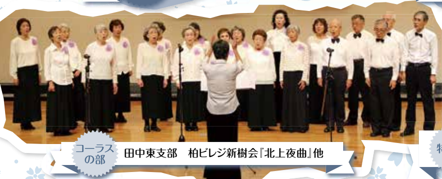
コーラスの部 田中東支部 柏ビレジ新樹会『北上夜曲』他