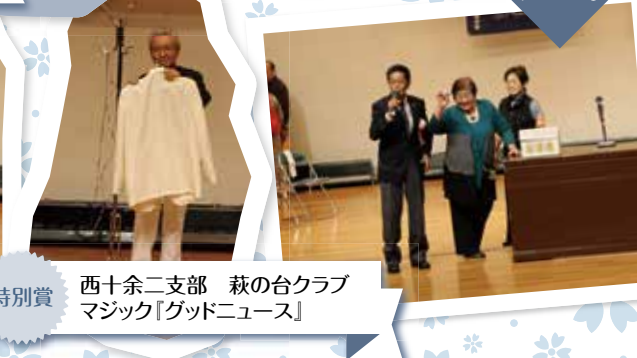
特別賞 西十余二支部 萩の台クラブ マジック『グッドニュース』