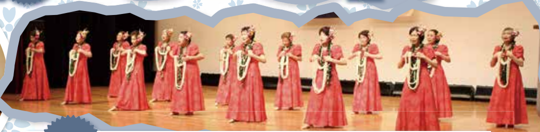
準優勝 中央支部 羽黒友の会 フラダンス『カマカニカイリアロハ』