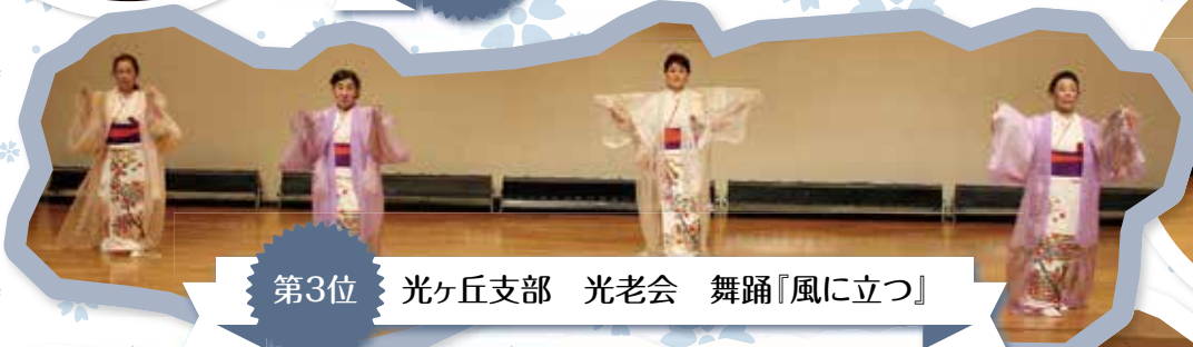
第3位 光ヶ丘支部 光老会 舞踊『風に立つ』